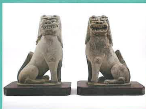
伊井白山神社石造狛犬(市指定)