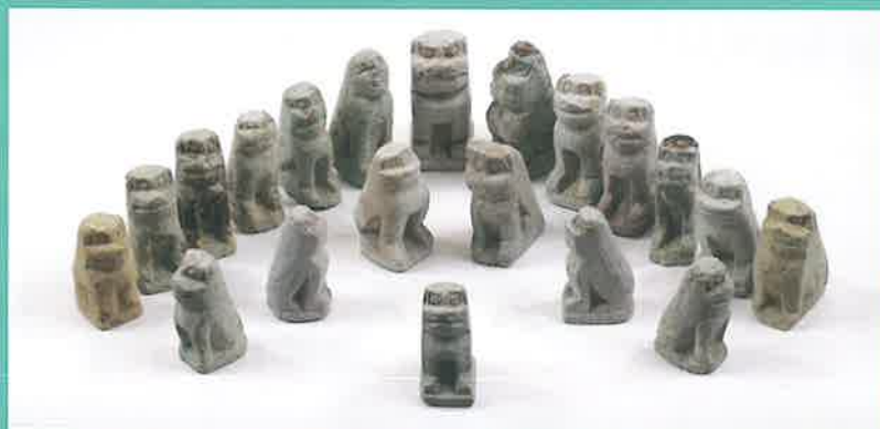
波松白鬚神社石造小狛犬群