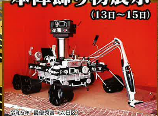
令和5年・最優秀賞(六日区)