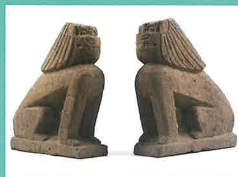
宮谷八幡神社石造狛犬(あわら産石製)