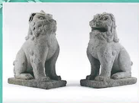
石造狛犬-永正十四年銘-(県指定)