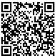
第1回市民会議アンケート