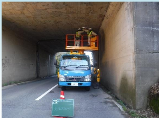
高所作業車による点検