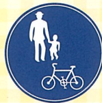
普通自転車歩道通行可

「普通自転車歩道通行可」の標識がある場合などは、普通自転車は歩道を通行することができます。