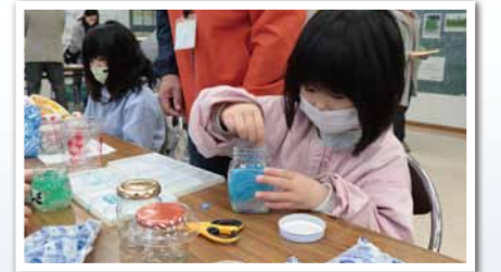
家にある保冷剤でオリジナル消臭剤を作りました