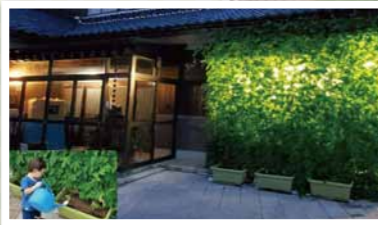
一般の部 最優秀賞

今年から「グリーンカーテンマイスター」に認定された方の作品をコンテスト投票内で展示しました!