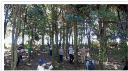
令和4年5月 植樹から22年トリムの森は今!