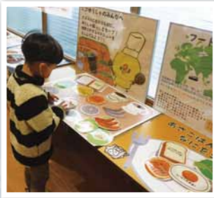
国内産と外国産のCO2排出量を比べます