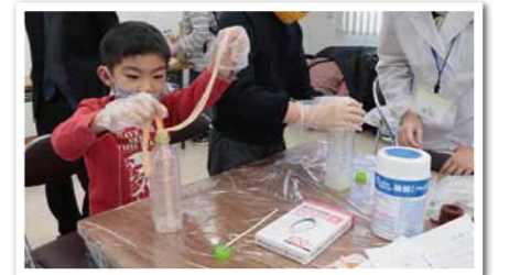
自然由来の素材に光を放つ粉末を混ぜた「光るエコスライム」です