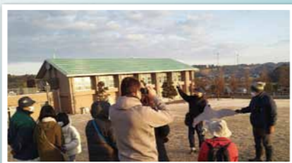
令和5年2月 早朝の北潟の空を見上げて見よう!「雁行」