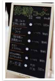
充実した体験コーナー

今回は、体験コーナーがパワーアップしたり、新しいコーナーを企画したりなど、昨年よりも充実した内容となりました。