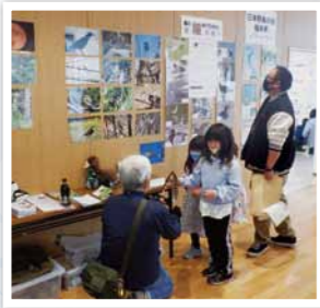
鳥の羽根をさわって違いを感じます

協力団体：あわらの自然を愛する会、環境ふくい推進協議会、北濃湖自然再生協議会、NPO法人グリーンウェル、自然食品の店ヒノモト、あわら市消費者センター、食生活改善推進委員、日本野鳥の会福井県、福井県地球温暖化防止活動推進センター