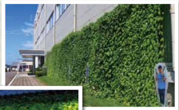
事業所の部 最優秀賞