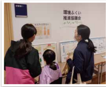
エコにまつわるクイズラリーも