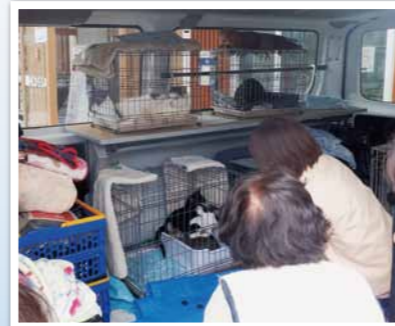
当日は7匹の保護猫がきてくれました