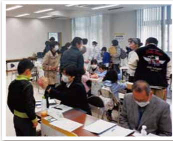
常に人がいっぱいの大ホール