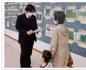
入賞者の表彰も行いました