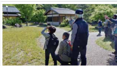
令和4年5月 こんな鳥見たよ!