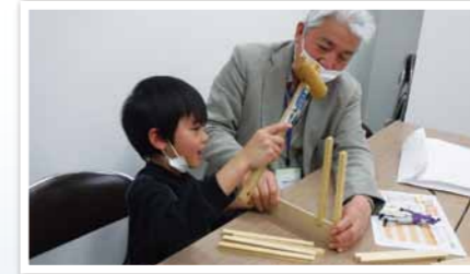
数種類の木を組み合わせで自分だけの時間割を作りました