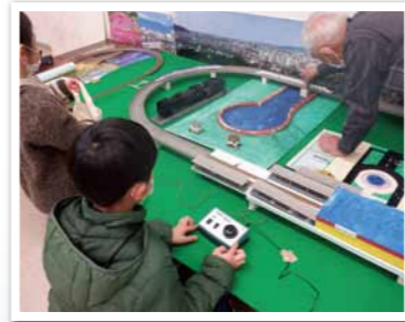
模型展示コーナー