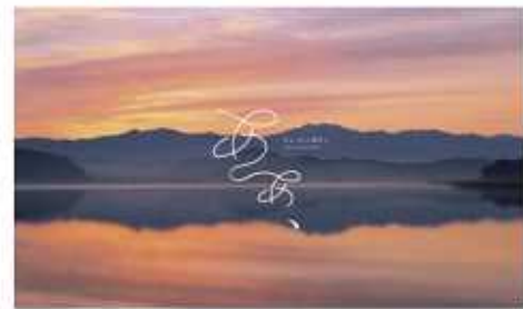
■ ああ、あわら贅沢。Tシャツデザイン