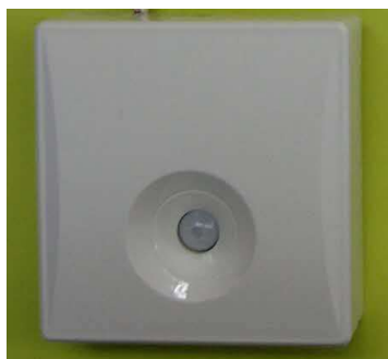
安否送信センサー (人の体温を感知します)

・センサーは人の動きを検知し、設定時間内(4:00~11:00)に動きがなければセンターに自動通報します。センターから利用者・家族等へ確認の電話をし、安否確認ができない場合は利用者宅へ出動します。