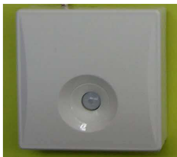
安否送信センサー (人の体温を感知します)

・センサーは人の動きを検知し、設定時間内(4:00~11:00)に動きがなければセンターに自動通報します。センターから利用者・家族等へ確認の電話をし、安否確認ができない場合は利用者宅へ出動します。