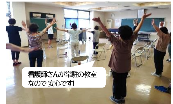
看護師さんが常駐の教室なので安心です!

だれでも気軽に 楽しく参加できる内容なので、ご体験がまだという方はぜひ一度ご見学ご参加ください。