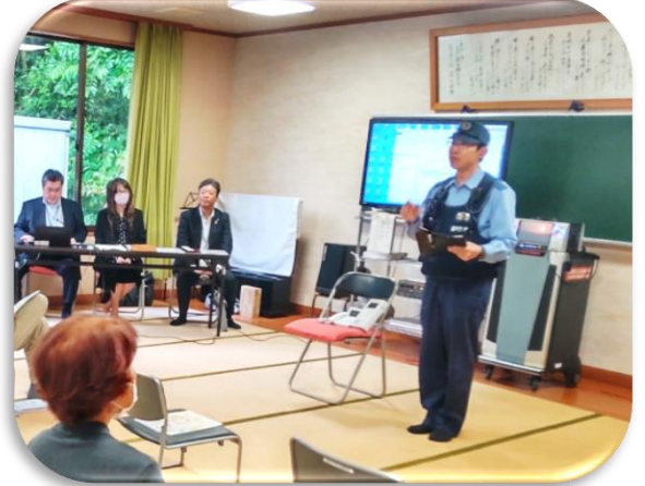
特殊詐欺ビデオ放映