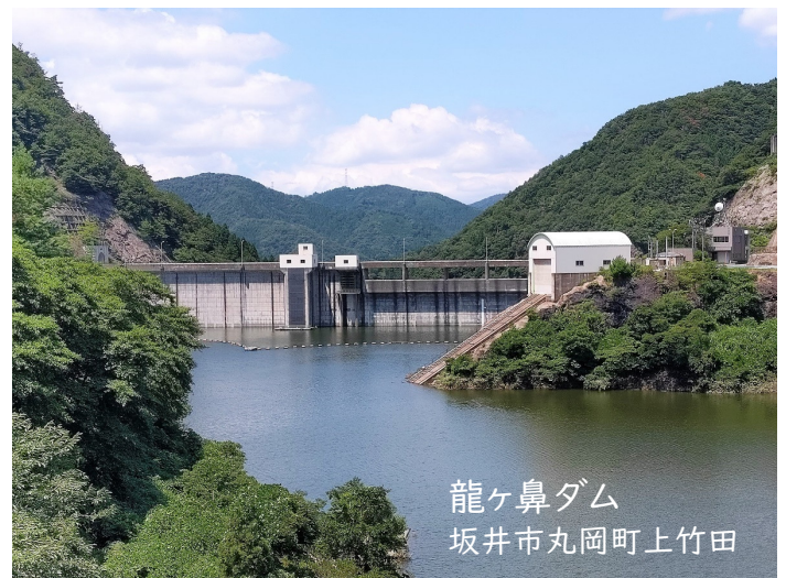
龍ヶ鼻ダム 坂井市丸岡町上竹田

吉崎地区の下水は、なんと九頭竜川河口の「九頭竜川浄化センター」まで送られます。下水管も傾斜をつけて自然流下を活用しますが、平地では深くなりすぎないように5～6mの深さになるとマンホールポンプで持ち上げて再び浅いところから流します。このポンプはあわら市内に71箇所、他に大型の中継ポンプ場が4箇所あるそうです。下水道も大切な設備ですので、生活排水以外の油・薬品・異物を流さず、正しく使いましょう。