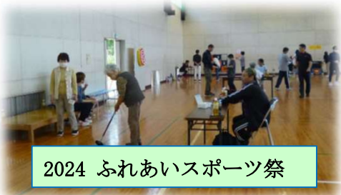
2024 ふれあいスポーツ祭