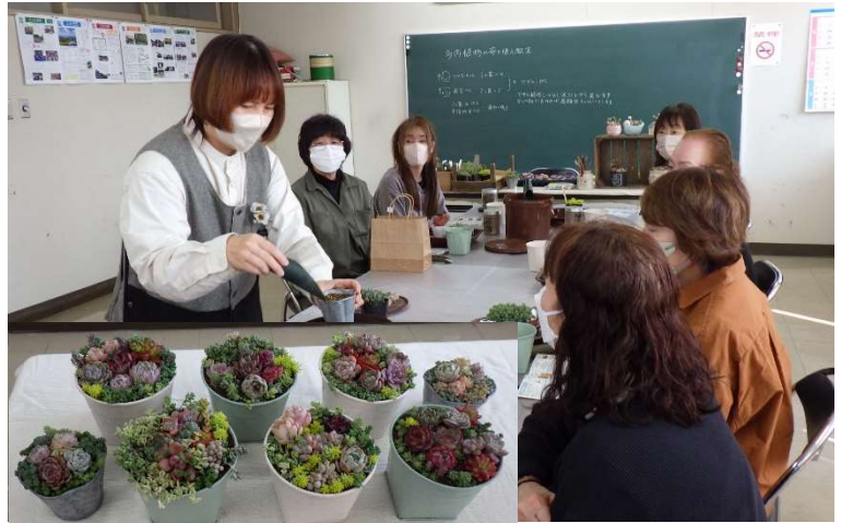
●ギャザリング&寄せ植え教室 3/16