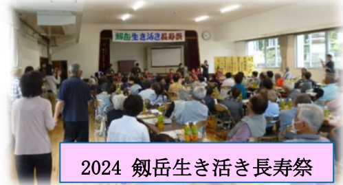
2024 剣岳生き生き長寿祭