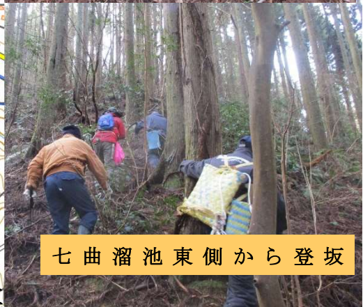
七曲溜池東側から登坂