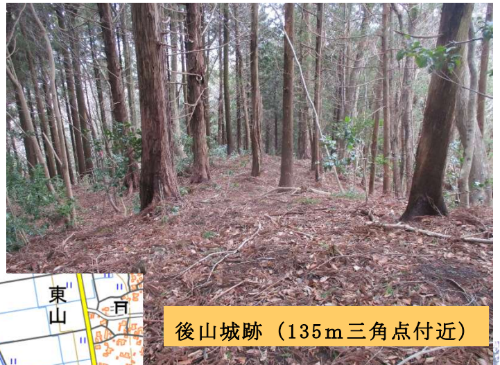
後山城跡 (135m三角点付近)