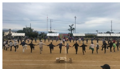
フレイル予防体操