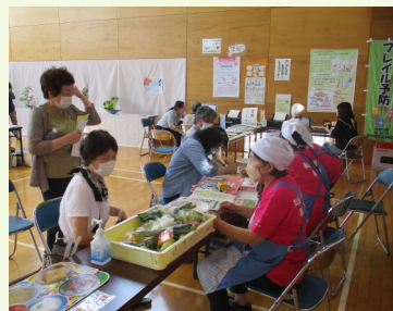
野菜摂取量&脳年齢測定