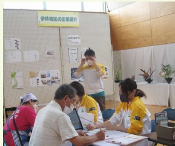
ベジチェック&血管年齢測定