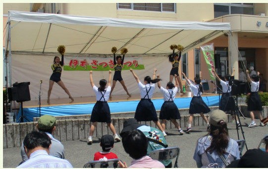
オープニングショー