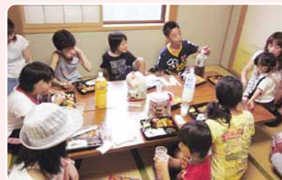
最後は、区民館でお食事。お疲れ様でした～