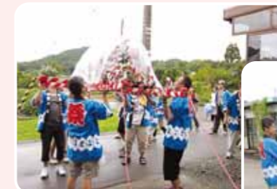
北区の中を練り歩く子ども神輿