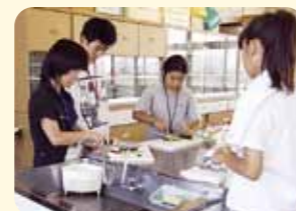
手巻き寿司に挑戦!