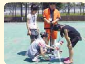
ペットボトルロケット飛ばし