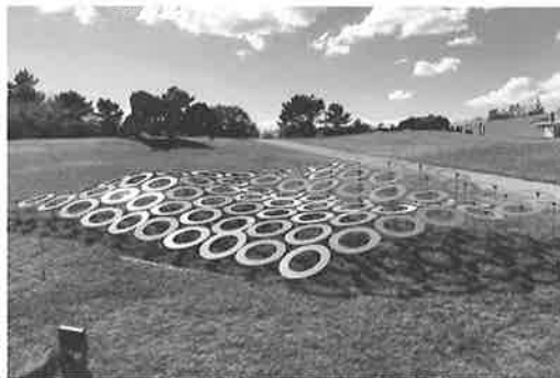
参考作品 1.《KALEIDO-SCAPE》2016おおさかカンヴァス2016(大阪万博記念公園・大阪府) 2.《STAIRS》2016 グランシップアートコンペ(静岡県) 3.《Lightning Scape》2018(船橋アンデルセン公園子ども美術館・千葉県) 4.《六甲富士》2017 六甲ミーツ・アート芸術散歩2017(六甲山・兵庫県) 5.《sky undulation》2022 第29回UBE BIENNALE(宇部・山口県) 図版はすべて ©Yusuke IGUCHI Photo:Kuganhiro KAWAMOTO(1・4), Kenta HOSHINO(2・3), Hajime MAJIMA(5)