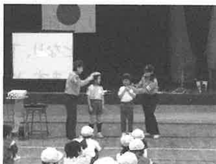
正しいヘルメットのかぶり方を学ぶ児童