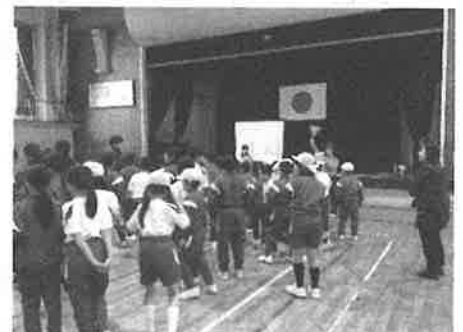
「交通安全〇×クイズ」に挑戦！