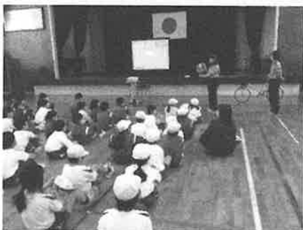
自転車の乗り方の話を聞く東っ子

子どもたちには、今回学んだことを忘れずに、日頃から、「自分の命は自分で守る」という意識を高めさせていきたいと思えます。