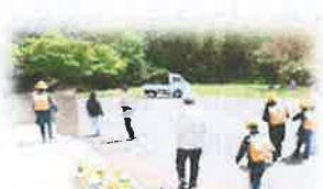
引き渡し訓練【体育館で地区毎に整列 → 体育館入り口で受付 → 地区担当が引き渡し】