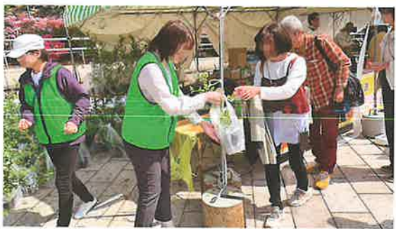
緑化苗木の配布活動 (鯖江市)