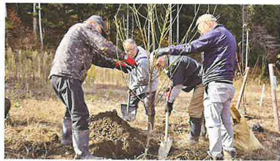
地域での緑化活動 (大野市)