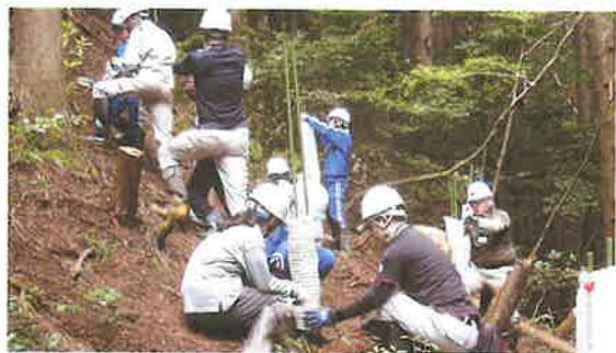
子ども達の森林学習活動 (小浜市)