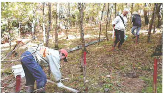
ボランティアによる森づくり活動 (永平寺町)