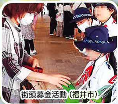
街頭募金活動（福井市）