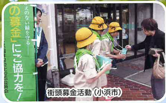
街頭募金活動（小浜市）