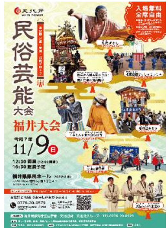
第 67 回近畿・東海・北陸民俗芸能大会 福井大会のポスター

11月9日(日)福井県民ホールで開催された『第67回近畿・東海・北陸ブロック民俗芸能大会』オープニングでは、福井県代表として北潟民謡保存会の皆さんがどっしやどっしや踊りを披露しました。