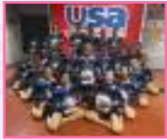
▲まなびサイト チアダンスWINGS ステージ