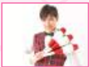
▲パフォーマーかつや