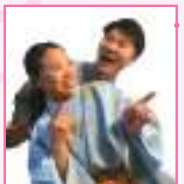
▲尾張万歳今枝社中 (おわりまんざいいまえだしゃちゅう)