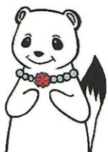
更生保護女性会 マスコット オコジョさん

保護司はボランティアです。 あわら地区では 18名が活動しています。 更生保護女性会は改善更生に 協力するボランティア 団体です。あわら地区では 131名が活動しています。