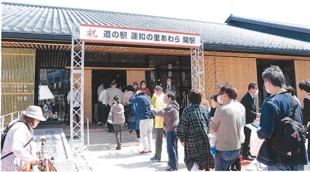
吉崎道の駅 蓮如の里あわら 開駅の様子