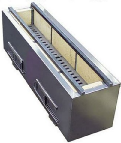
【安全な距離の基準 (cm)】

炭火焼き器を設置の際は、 建築物等や可燃性の物品までの安全な距離が必要となります。