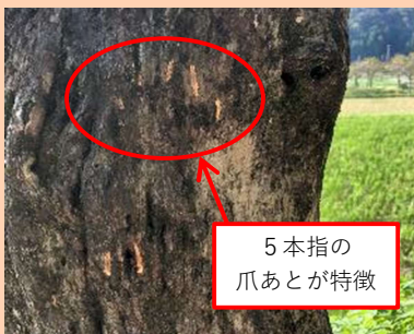
5本指の爪あとが特徴