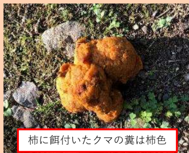
柿に餌付いたクマの糞は柿色