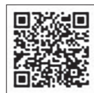
▲ 取扱店募集中 申込みはこちら

6月1日から、「あわら暮らし応援商品券」が市内の取扱店で利用できるようになりました。利用期間は8月末までとなっておりますので、忘れずにご利用ください。 取扱店は随時更新しています。最新情報は市ホームページをご覧ください。 ※5月中に対象者へ1人あたり1万円分の商品券を送付しました。条件を満たす人で、まだ商品券が届いていない場合は、商工労働課までご連絡ください。