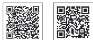
▲ 申込みはこちら ▲ ホームページ

今年もビア電を実施します。三国港駅に停車した車両内から日本海に沈む夕日を眺めながら、ゆったりとした時間を楽しめます。車内では、生ビールや日本酒、ソフトドリンクが飲み放題で、飲食物の持ち込みも可能です。夏のひとつを、特別な空間でお過ごしください。 とき 7月26日(日) 18時 ところ あわら湯のまち駅集合 対象 20歳以上のあわら市えちぜん鉄道サポーターズクラブ会員 ※当日の会員加入も可能 年会費は個人:1,000円 ファミリー:5,000円