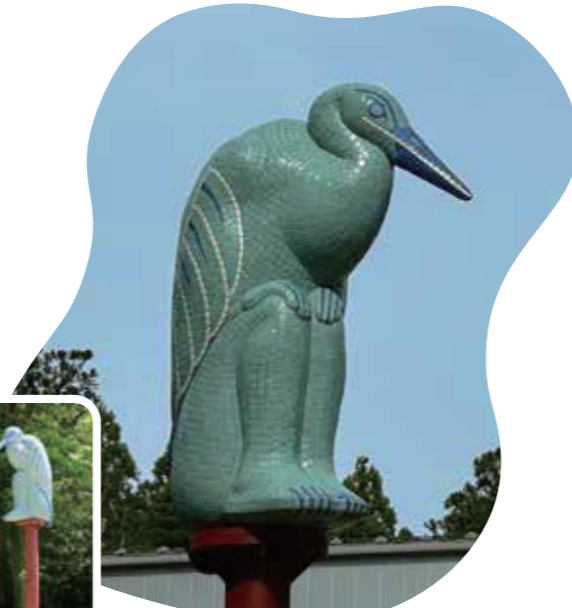
《polaris》2026年制作 素材:鉄、ジェスモナイト、陶タイル

時間 10:00~17:00 (最終入場 16:30) 会場 金津創作の森美術館 アートコア ミュージアム-1、野外美術館 休館日 月曜日(祝日開館、翌平日休館) 観覧料 一般600円(400円)、65歳以上・障がい者300円、 高校生以下・障がい者の介護者(当該障がい者1人につき1人) 無料 ※( )内は20名以上の団体割引