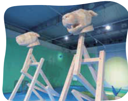
《ミアキス》2026年制作 素材:木

「太陽と月」「古代と現代」一。正反対のものが共存する不思議な世界観を通して、生きている喜びや感覚を呼び覚ます展示です。