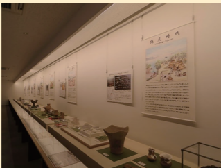
常設展示ゾーンの風景 ▶