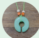
ペンダントイメージ

古代の創作物から作品の着想を得て制作されていることにちなみ、あわら市で発掘された縄文時代の石製耳飾りをモチーフにしたペンダント作りとその歴史を学ぶ縄文ピアスのプチ講座を開催。完成したペンダントを身につけてガイドと共に展覧会を巡ります。