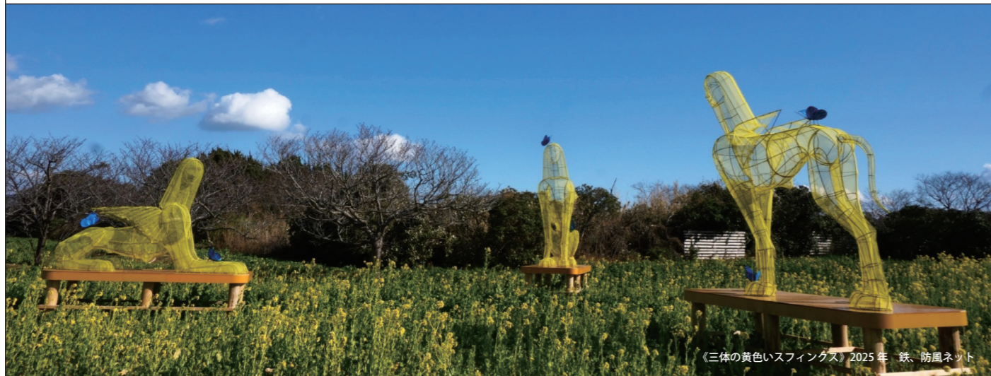
《三体の黄色いスフィンクス》2025年 鉄、防風ネット