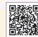
▲ 子ども・子育て支援金制度について

問合せ 市民課 保険年金G ☎ 73-8015 税務課 市民税G ☎ 73-8011