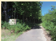
旧北陸道（細呂木宿～橘宿）▶

郷土歴史資料館（金津本陣 IKOSSA 2階） 休館日 月曜日・第4木曜日（祝日の場合はその翌日）