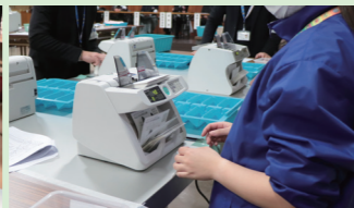
▲ 投票用紙を数える様子