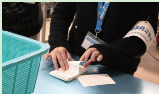
▲ 投票用紙を点検する様子