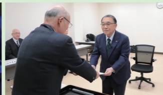
▲ 当選証書付与式の様子