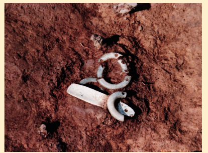
▲ 桑野遺跡 18号墓穴石製アクセサリー発見状況

とき 4月12日(土)～5月11日(日) ところ 郷土歴史資料館 特別展示室 入場料 無料