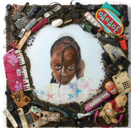
◀真実の湖 Can you hear me? >

世界最大級の電子機器の墓場と言われるガーナのスラム街・アグボグブロシーに集積した廃棄物を素材にアート作品を制作する美術家長坂真護(福井市出身)の個展。