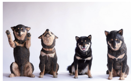
はしもとみお彫刻展 音を刻むいきものたち 4/19(土)～6/15(日)

等身大の動物たちの彫刻作品を作る彫刻家・はしもとみお。本展では、生命の一瞬一瞬の美しさを形として残してきたこれまでの木彫作品をはじめ、丹念に観察した動物たちのスケッチなどの資料を一同に展示します。はしもとが生み出す、愛くるしい動物たちの世界をお楽しみください。