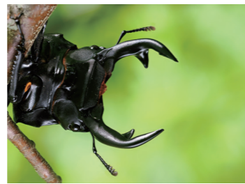
タイワンオオクワガタ(グランディスオオクワガタ)の肖像 撮影年 2022年