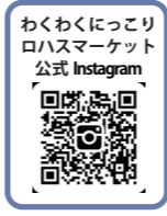
主催: わくにっこり実行委員会 共催: (公財)金津創作の森財団

自然の中でこだわりの作品と出逢えるマルシェ、お気に入りの食器で味わうフードブース、子どもも大人もわくわくするアクティビティで、ロハスな2日間を楽しんでいただけます。イベント特別企画のからだにやさしいお菓子まきや、端材で遊ぶアルモンデあそびパークもあります。今年は市民・企業・行政が集まり、環境やエコ、ロハスを知るきっかけになる場所づくりを目指します。