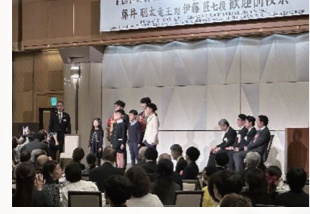
▲ 第36期竜王戦北九州対局前夜祭(福岡県北九州市)