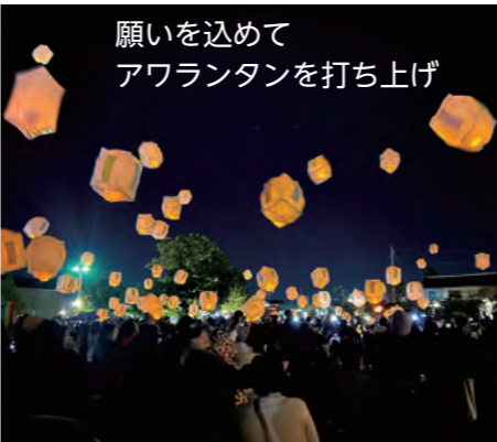
願いを込めてアワランタンを打ち上げ