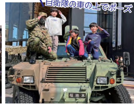
自衛隊の車の上でポーズ！