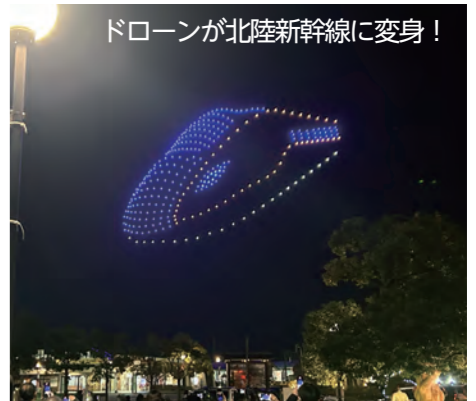
ドローンが北陸新幹線に变身！