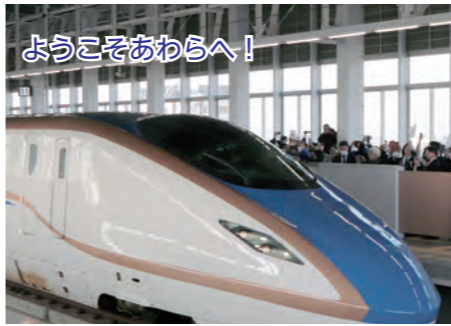
ようこそあわらへ！