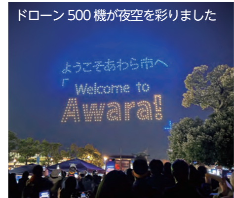
ドローン 500 機が夜空を彩りました