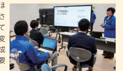
▲「プレゼンに挑戦してみよう！」の様子

地域活性化起業人に着任して3年目を迎えました。最近、こちらのコラムを読んでくださっている人からお声がけいただくことが増えました。とてもうれしく思っています。ありがとうございます！ さて、新年度や新学期が始まり、気持ちを新たに仕事や勉強に取り組もうと考えている人も多いと思います。新しいことを始めたいという気持ちが沸いたとき、心の奥からワクワクした気持ちが沸き上がってきませんか？ 昨年度、市役所のDX推進員の取り組みで、「プレゼンに挑戦してみよう！」という勉強会を実施し「目標設定」をテーマに職員に発表していただきました。普段の業務のなかで、資料を作り、人前で発表する機会がない職員がほとんどでしたが、堂々と発表されている姿はすてきで、輝いてみえました。日頃から小さな変化に慣れておく、また小さな成功体験を積み重ねることが重要かもしれませんね。