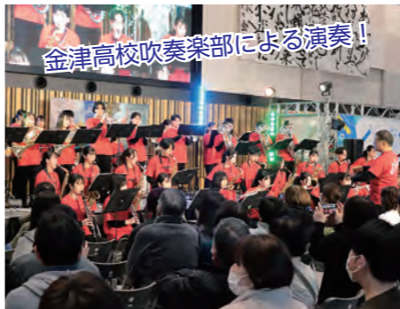
金津高校吹奏楽部による演奏！