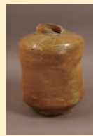
▲多賀谷左近三経蔵骨器