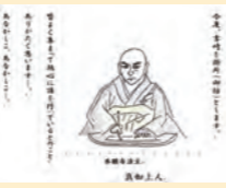
▲イラストパネルの一例

郷土歴史資料館 (金津本陣 IKOSSA 2階) 休館日 月曜日・第4木曜日(祝日の場合はその翌日)