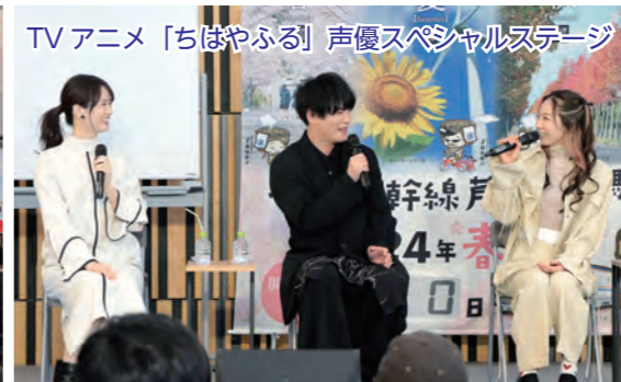
TVアニメ「ちはやふる」声優スペシャルステージ