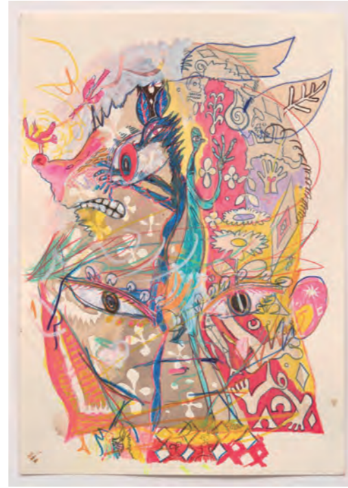
《星屑の子供》2024年、紙に色鉛筆、アクリル、水彩、H29.7xW21cm ©Yusuke Asai, Courtesy of ANOMALY