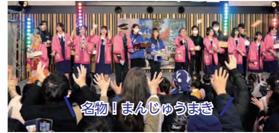
名物！まんじゅうまき