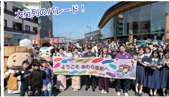
大行列のパレード！