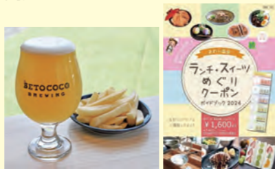
▲初のアルコール ▲ガイドブックが目印