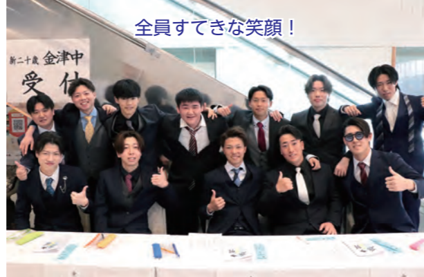
全員すてきな笑顔！