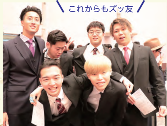
これからもズッ友！