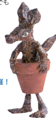
《星屑の子供》2024年、個人蔵 ©Yusuke Asai

会期中は上記以外にも関連プログラムを多数開催！ 詳細は当館ホームページ・SNSをご覧ください。