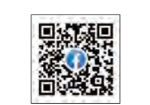
▲過去の活動について

あわら市エコ市民会議のメンバーになって一緒に活動しませんか？あわら市エコ市民会議では、市の素晴らしい環境を次世代に引き継ぎ、これからの市の環境を考えるために2つのグループに分かれて活動をしています。