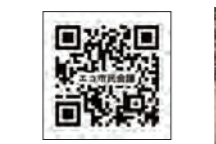
▲入会申込書のダウンロードはこちら