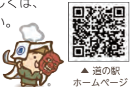
▲道の駅ホームページ