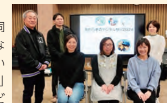
▲ 企画運営した「プログラミング講師」の皆さん

参加した子どもだけでなく、同伴でお越しの親御さん、そしてなにより運営スタッフが楽しんでいたのが印象的でした。「あわらから」新しいこと、面白いことをどんどんやっていきたいですね!