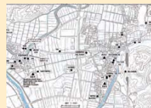
▲坪江地区での聞き取り結果

情報はまだまだ不足しています。皆さんの身近にある"お宝"の情報がありましたら、郷土歴史資料館までお知らせください。