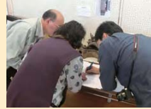
▲細呂木ふれあい祭での様子

12月号で「あわら市文化財保存活用地域計画」を令和7年度を目標に策定することをお知らせしました。地域の皆さんの大切な文化財を守っていく計画であることを知っていただくため、各地区の公民館祭に出展し、皆さんが大事にしている行事や言い伝えなど、埋もれている"お宝"の聞き取りを行いました。各地区からたくさん情報が集まり、それらの結果をまとめ、今後の計画策定に活かしていきます。