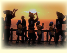
▲ 昨年の入賞者作品 東尋坊

問合せ (一社) あわら市観光協会 ▲詳しくはこちら ☎ 78-6767 (平日 8時30分～17時)