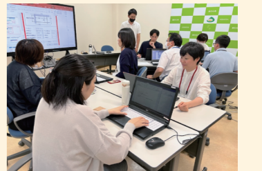
▲DX推進員勉強会の様子

思考法のトレーニングを重ねることで、さまざまな情報を考察、分解、整理することができ、新たな価値を生み出せるようになります。対話する相手に筋道立った説明が行える。誰も思いつかないような発想がひらめくなど、ビジネスだけでなく、人生にも役立つスキルを習得することができます。年齢、学歴に関係なく、思考は鍛えられますよ。