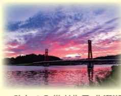
▲ 昨年の入賞者作品 北潟湖