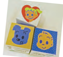
シークレット BOX 何が当たるかお楽しみキーホルダー BOX。人気 No.1 のグッズ！