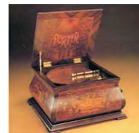
ディスクオルゴール (アメリカ製)