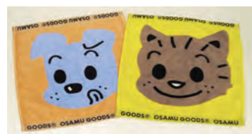
ウォッシュタオル 大判柄の復刻版デザインが大人気！