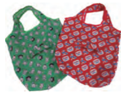
エコバッグ カワイイ絵柄が豊富！