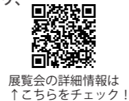
展覧会の詳細情報は ↑こちらをチェック！

開館時間 / 10 : 00 ~ 17 : 00 (最終入場 16 : 30) 休館日 / 月曜日 (祝日開館、翌平日休館) 観覧料 / 一般 800 円 (600 円)、中学・高校生 600 円 (400 円)、65 歳以上・障害者各半額 小学生以下・障害者の介護者 (当該障害者 1 人につき 1 人) 無料 ※ ( ) 内は 20 人以上の団体料金