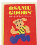
ポストカードブック 名作イラストが大集合。 部屋に飾る楽しみも good !