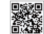
▲申し込みはこちら

市内でママ同士が繋がれる場所や機会を提供し、子育てしやすい環境をつくることを目的に活動しているCheersとあわら市が主催で「夏休みの宿題&プログラミングゲーム」を企画しました。ぜひ、この機会に夏休みの宿題を終わらせちゃいましょう。宿題の後は「Toi」というロボットで楽しく遊ぶ時間もありません。 とき 8月5日(土) 9時50分~12時 ところ 坪江公民館 対象 小学生(保護者同伴) 参加費 1組500円(飲み物付き) ※子ども追加1人は200円 付き添いは無料