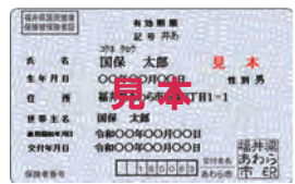
国民健康保険被保険者証