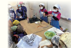
▲朝ごはん応援プロジェクト