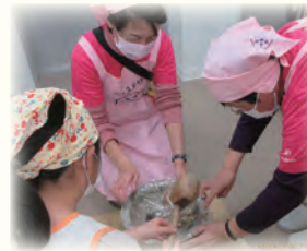
▲子ども教室「伝承料理教室」