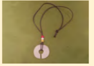
▲ けつ状耳飾ペンダント

参加費 一人200円 定員 30人(先着順) 申込み 6月24日(土)受付開始 電話またはメール、FAXで申し込みください。