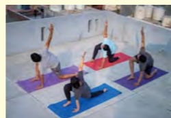
▲画像はイメージです。

問合せ (一社) あわら市観光協会 ☎ 78-6767 (平日 8時30分~17時)