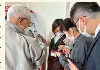
▲キャッシュレス決済体験お買い物ツアーの様子

ここまで自治体に取り組んでいるというのは、私の知る限り他にありません。賛否両論あると思いますが、スマホの操作に不安がある高齢者の皆さんがスマホを不安なく使えるようになる施策って、このようなことだと思います。