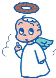
ミスタードーナツキャンペーン用キャラクター 1976 年 作：原田 治

東京都生まれ。多摩美術大学デザイン科卒業。1970 年、当時創刊された「an・an」でイラストレーターとしてデビュー。1976 年、「マザーグース」を題材にしたオリジナルのキャラクターグッズ「OSAMU GOODS」の制作を開始、女子中高生の間で大人気となる。1984 年、ミスタードーナツのプレミアム (景品) にイラストを提供。以降、シリーズ化され一世を風靡する。1997 年、イラストレーターを養成する「パレットクラブスクール」を、生まれ育った築地に開設。