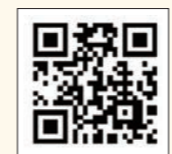
▲ スマホでの申告はこちら