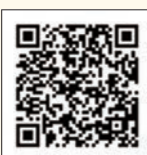
▲ LINEアカウントはこちら