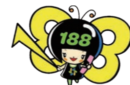
消費者庁 消費者ホットライン 188 イメージキャラクター 「イヤヤン」

とき 12月1日(木) 14時～16時（一人約30分） ところ 消費者センター相談室（市役所1階） 定員 4人程（予約制） 申し込み 【期限】11月29日(火) 問合せ 消費者センター（生活環境課内） ☎73-8017