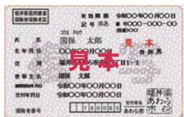
国民健康保険被保険者証