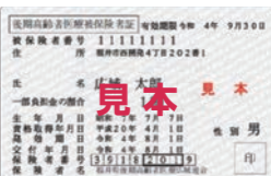
後期高齢者医療被保険者証

現在お使いの保険証の有効期限は、令和4年7月31日までとなっています。 新しい保険証は、7月下旬に簡易書留で郵送しますので、氏名や住所に誤りがないか、必ずお確かめください。 8月に入っても保険証が届かない場合は、お問い合わせください。 問合せ 市民課 保険年金G ☎ 73・8015