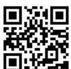
▲セントピアあわらホームページ

セントピアあわら 入浴割引券 (1枚あたり2割引) 期間：R4.1.31 1枚で5人まで キリトリ